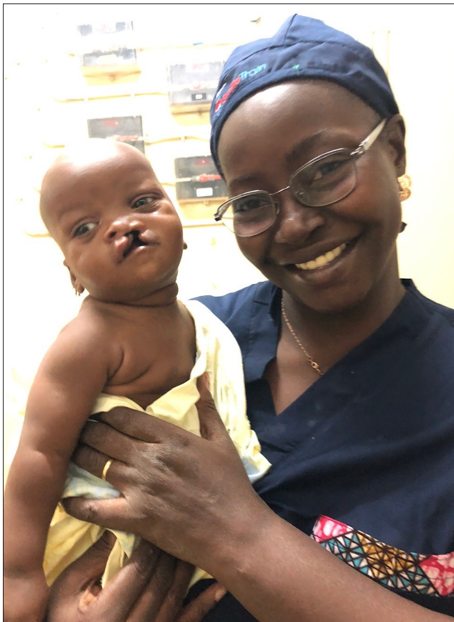
Moment de tendresse avant l'opération.

J'ai aussi eu la chance de rencontrer le comité de EPE en Suisse autour d'un repas... des gens extraordinaires qui ont fait que je me sentais comme chez moi. Merci infiniment pour tout ce que vous faites pour les malades au delà du côté financier. Vous leur accordez une partie de votre temps en étant avec eux dans les bons et les mauvais moments. Pour moi, ça n'a pas de prix. Je vous serai éternellement reconnaissante. Puisse Dieu nous accorder une vie pleine de santé pour qu'on puisse continuer à servir cette noble cause.