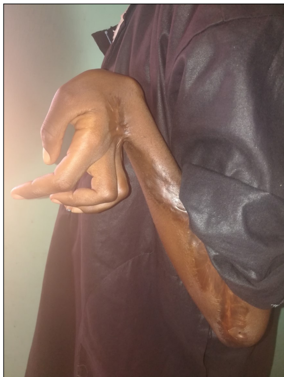
Rétraction suite à une brûlure.