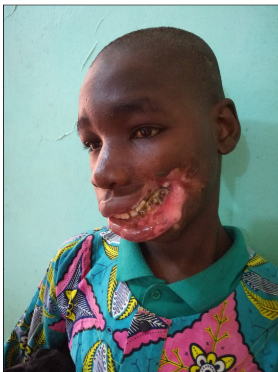
Séquelle de noma.