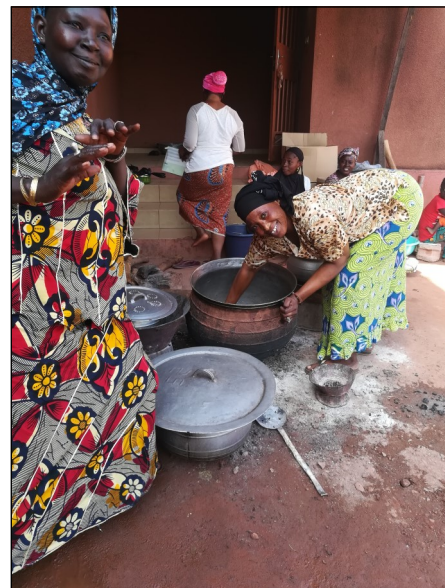
Cuisine dans la bonne humeur.