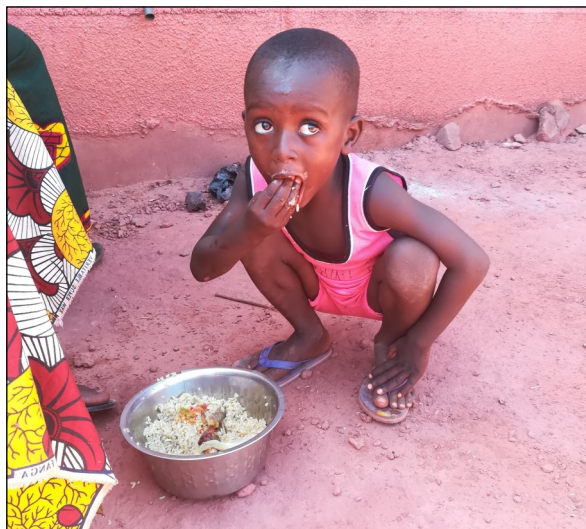
Vie en mission.

Mali et 4 au Burkina Faso), avec 82 patients opérés pour des pathologies diverses. 30 enfants et