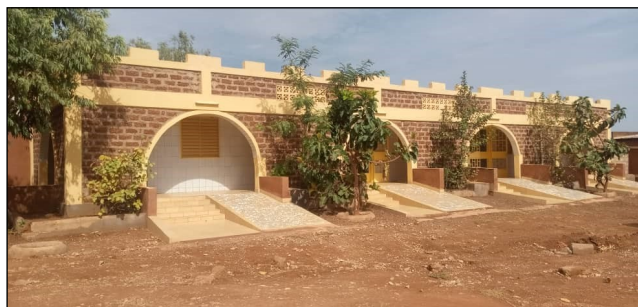
Local de physiothérapie à PERSIS.

Citons aussi que le Centre Persis incite et encourage son personnel à entreprendre diverses formations