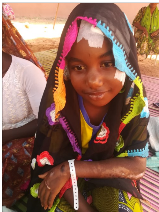
Grefe suite à une brûlure.