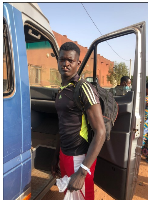
Départ pour l'opération.

C'est ici que la prospection et le recrutement de tous les patients ont lieu. Les patients y sont préparés et convoqués, quelques jours avant parfois, pour y pratiquer les examens pré-opératoires ou pour retaper un ou des malades dont l'état général n'est pas bon. C'est aussi dans ce centre que les patients et leurs accompagnants sont hospitalisés après les opérations afin d'y recevoir les soins nécessaires. Ce centre est «grouillant» de personnes pendant la mission et l'animation apporte à toute cette cour colorée joie, vie et actions. Afin de se protéger du soleil, nous dressons une grande tente que nous dressons au centre de cette cour qui est si animée et riche !