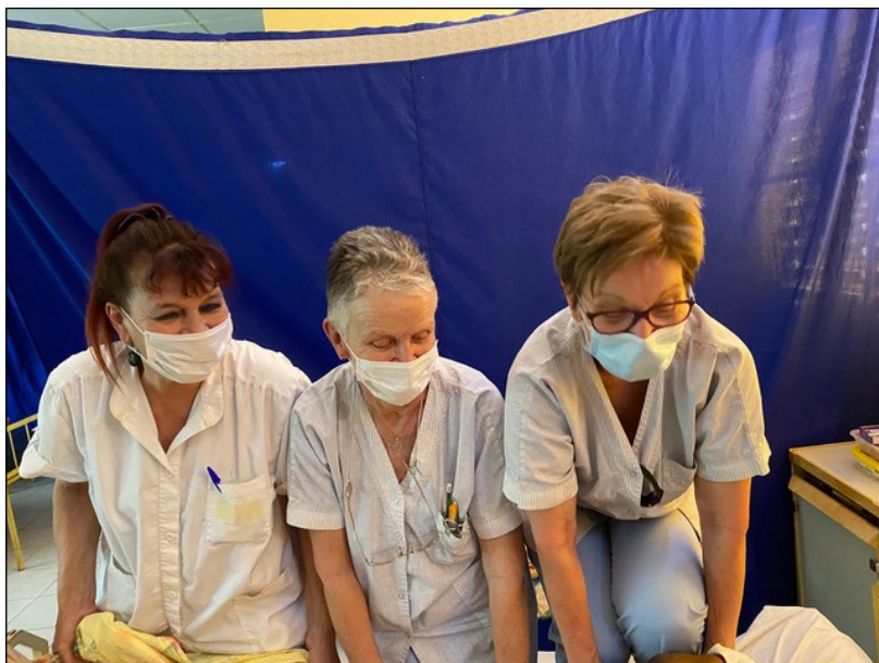
L'union fait la force pour le transfert d'un malade.