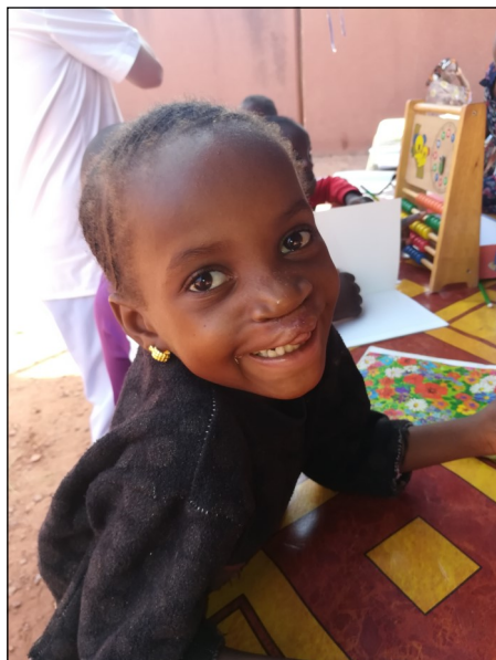
Sourire après une grande souffrance.