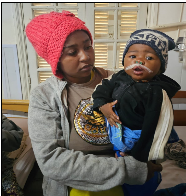
À la clinique, juste après l'opération et déjà le bonnet.