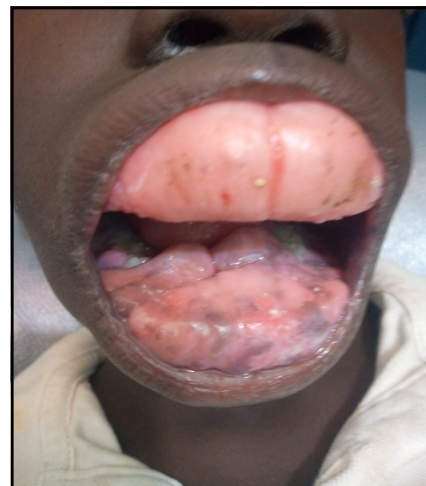
Tumeur de l'os chez un enfant de 7 ans.

Le centre HIRZEL, très beau et fonctionnel, cherche un sponsor, un ou des donateurs pour financer son FONCTIONNEMENT. L'AFD (agence française de développement) s'est retirée fin 2022 et nous cherchons toujours les fonds pour assurer le budget de fonctionnement du centre.