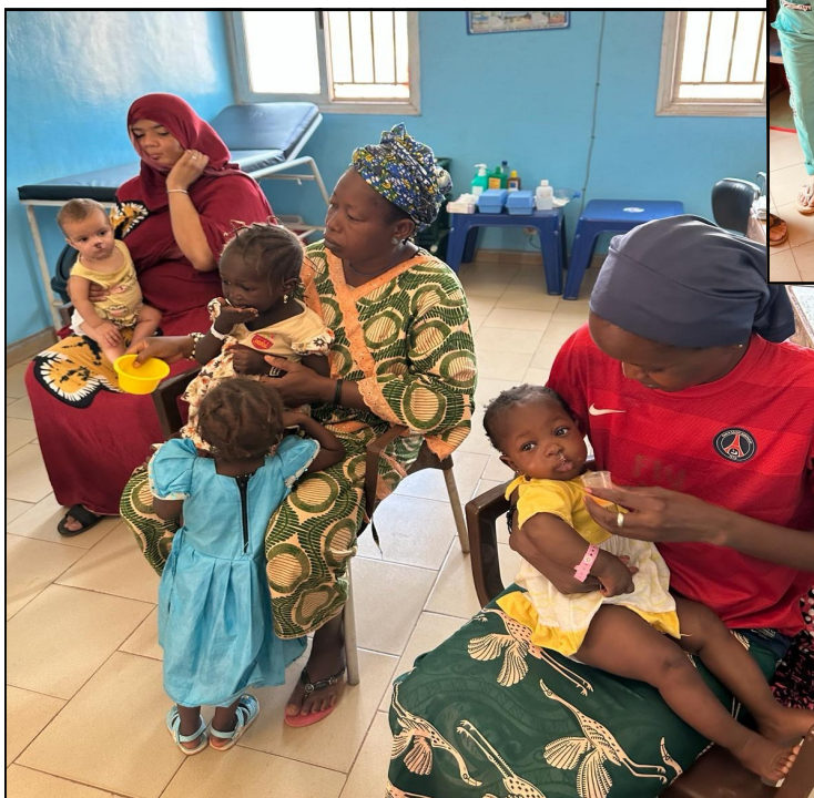
Soins et médicaments après chaque repas.