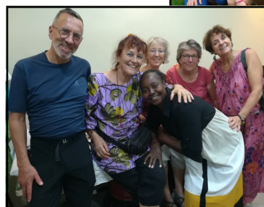
Photo des bénévoles EPE missions de Bamako et Antsirabe.

«Le bonheur est une chose qui se multiplie par deux quand on le partage»