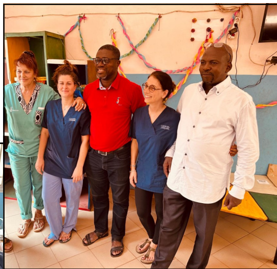
Responsables de Smile train et Hirzel.