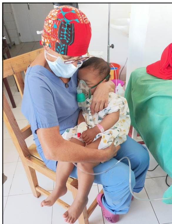
Chirurgienne, mais aussi maman et grand maman.