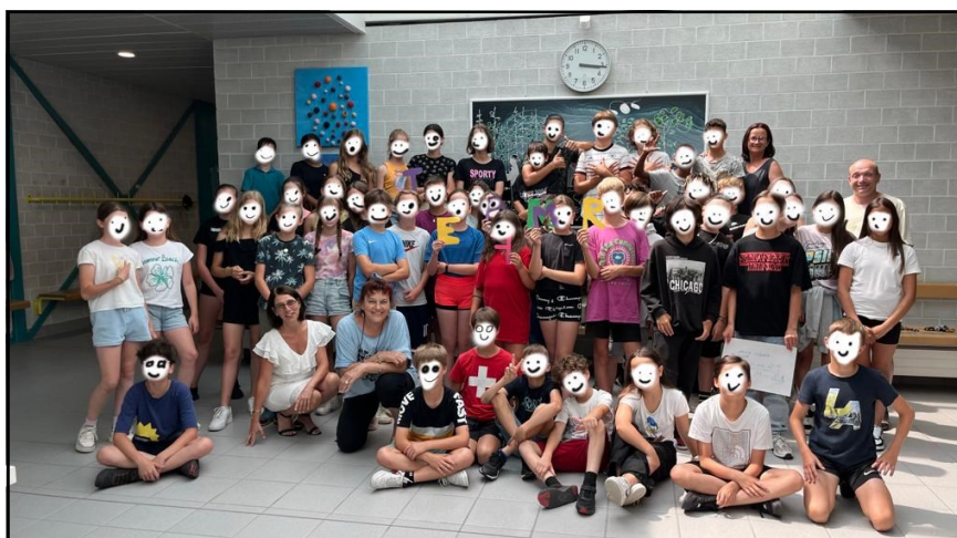
Classes du marché FMR

très fiers du magnifique savoir-être de ces jeunes élèves.