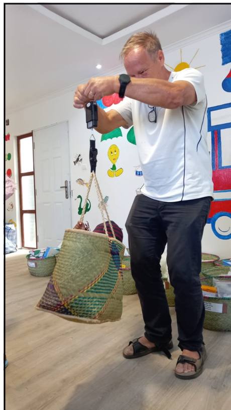
La pesée, on s'adapte!

L'Espace TSIKY, qui est notre centre de soins, situé en dehors de la ville, en pleine nature, a accueilli toutes ces fentes et un cas de noma pour le suivi. Notre collaboration avec le personnel malagasy a été excellente. Toutes les personnes de la Clinique sont très bienveillantes envers nous et le personnel de soins (4 infirmières) et les aides étaient heureux, tout comme nous, de fonctionner ensemble. Nous avons travaillé main dans la main et cela a abouti sur de beaux échanges et une collaboration fructueuse tant avec le personnel local qu'avec les Enfants du Noma.