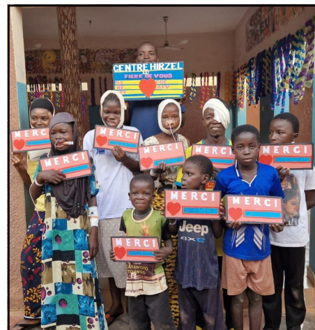
Les remerciements à la Fondation 21.

même année, nous les sollicitons pour le financement « spécial » des 2 missions « tumeurs et ankyloses » pour la somme de frs 16'000.- Une fois encore la Fondation 21 a répondu positivement et a ainsi permis de prendre en charge 20 très grosses interventions. Nous sommes d'une RECONNAISSANCE INFINIE ENVERS CETTE FONDATION. Grâce à eux, nous pouvons encore et encore œuvrer au sein des nos beaux projets maliens qui nous tiennent à